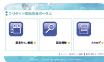
クリタイトポータルサイトの「製品情報」からアクセスしてください。

クリタイト®は、トレーサビリティシステムを導入し、どのように、生産・出荷されたかの情報をインターネットで確認できるようにしています。