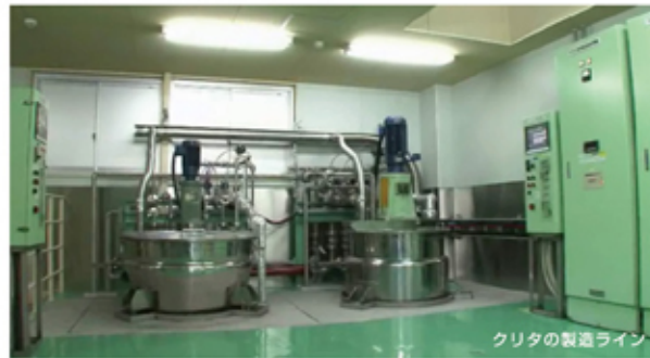
クリタの製造ライン

クリタイト®は、製造段階における他の原料や異物(工業グレードの化学薬品やごみや虫等)の混入を防ぐため、クリタイト®専用の製造ラインを設置し徹底した品質管理をしています。