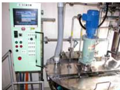
クリタイト製造設備