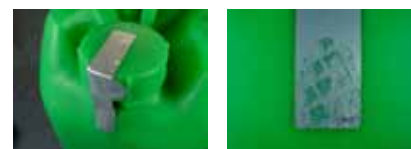
封印シール（右は一度剥がしたものの）

クリタイトは開封されていないことを示すための封印シールを採用しており、ひと目で開封状況が確認できます。