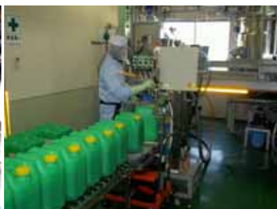
クリタイト製造工程