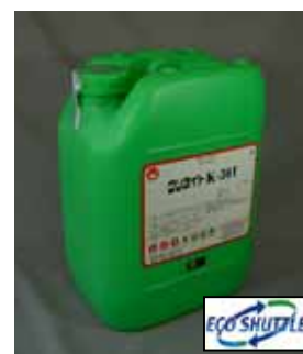
リターナブル容器回収システム「エコシャトル」 クリタの新しい循環型環境モデルです。

クリタイトは、クリタの廃棄物を出さないリターナブル容器回収システム『エコシャトル』を採用（一部商品を除く）。クリタイトの製造では全て新品容器を使用し、使用後の回収容器は洗浄後に他の商品の容器として再利用しています。